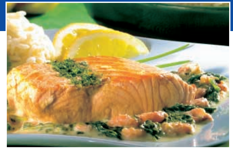
Zalm 'filet pur' in spinazie-garnalensausje uit 'Smakelijk ! 2', p. 133.

Kelvin is het eigen merk voor Colruyt-diepvriesvis: zalm, kabeljauw, staartvis, zeewolf, tong, victoriabaars, pangasius... U vindt er vis naar ieders smaak . Hebt u al eens koningskoraalvis of tilapia geproefd? Voor de verschillende bereidingen, biedt Colruyt u eenzelfde product in verschillende vormen aan. Zo vindt u bv. voor zalm: wilde of gekweekte zalm, filets of steaks ... De Kelvin-vis is klaar voor gebruik : schoongemaakt en meestal gefileerd zonder vel. Ideaal voor de bereiding van heerlijke gerechten!