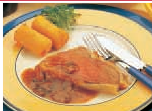
Biefstuk met tomaat, champignons en een vleugje dragon uit 'Smakelijk ! 1', p. 155.

Al het vlees is panklaar versneden. Wist u bijvoorbeeld dat u de keuze hebt uit vele verschillende soorten steaks, van chateaubriand en tournedos tot tussenrib (entrecote)? Naast biefstuk, varkenskotelet, worst of hamburgers, kan u uit onze diepvriezers nog heel wat specialiteiten kiezen zoals pakketten voor barbecue (brochettes ...), gourmet of fondue.