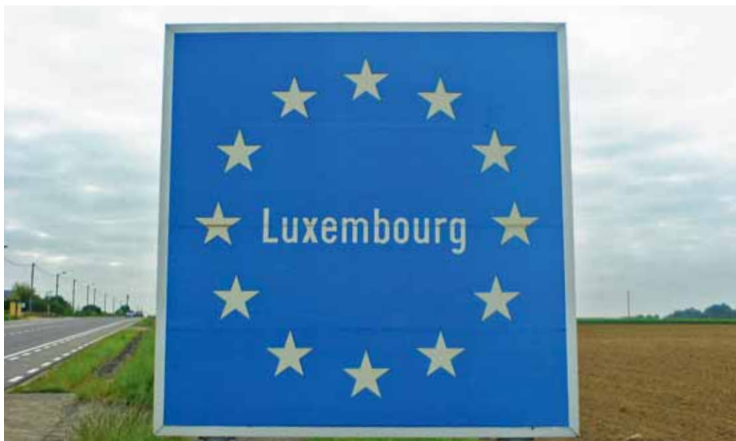
De laagste prijzen, nu ook in het Groothertogdom Luxemburg.

S inds 4 juni genieten ook de inwoners van het Groothertogdom Luxemburg de laagste prijzen bij Colruyt! Sébastien, gerant van de winkel geeft ons meer uitleg.