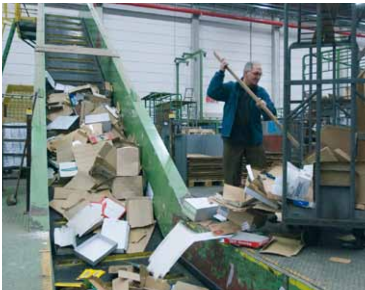
In het distributiecentrum sorteren we o.a. al het papier en karton voor recyclage.

Colruyt draagt zijn steentje bij om de afvalberg te verminderen. Dus doen we zo veel mogelijk aan afvalpreventie. Jaarlijks vermijden we tonnen afval door onze verpakkingen kleiner of dunner te maken, gewoon weg te laten of te vervangen door herbruikbare alternatieven. Het afval dat er toch is zoals karton, papier, glas en hout wordt gerecycleerd. Het overige afval wordt vergist of verbrand. De energie die daarbij vrijkomt, benutten we maximaal.