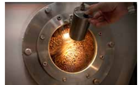
In de wervelkamerbrander worden de boontjes rondgezwierd door hete lucht.

In de trommelbrander worden espressobonen en boontjes voor de originekoffies van Graindor gebrand. Door het brandproces lang en traag te laten verlopen, komen de fijne aroma's van de arabica koffie helemaal vrij.