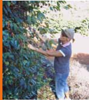
Rijpe bessen worden meestal met de hand geplukt, omdat een tak van een koffieplant op hetzelfde moment zowel bloesem, groene vruchten als rijpe vruchten kan dragen.

Arabica bonen zijn lang, groot en ovaal en hebben een laag cafeïnegehalte. Ze zorgen voor een milde, volle en fruitige koffie die helder van kleur is.